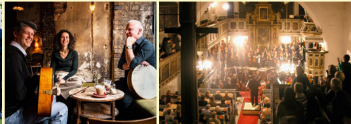
Peter-Pauls-Kantorei Sebnitz und Elbland Philharmonie Sachsen

Sonntag, 29. November 2026 · 16.00 Uhr George-Bähr-Kirche Hohnstein Musikalischer Gottesdienst am 1. Advent