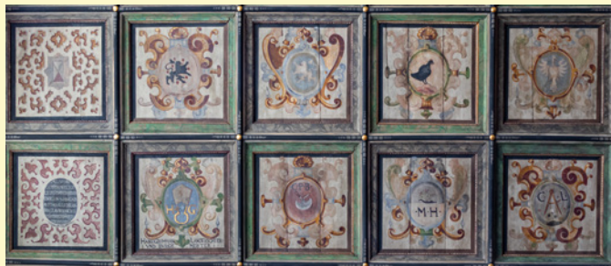
Kassettendecke in der Ev.-Luth. Stadtkirche Sebnitz

Freuen Sie sich schon auf das Musikinstrument des Jahres 2026: Das Akkordeon steht zum Eröffnungskonzert am 26. April im Mittelpunkt.